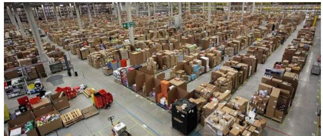
图片说明：仓库资料

的可维修性打分，满分为 10 分。该项分值根据备件和技术文件的可用性以及产品拆卸的方便性来计算。目前，智能手机、笔记本电脑、洗衣机、电视机等多种产品都必须显示该评分，旨在使消费者在购买设备时了解有哪些维修方案。通过引入这一指数，法国鼓励制造商在设计阶段考虑其产品的可维修性，进而从一开始就避免废弃物产生，并支持建立一个更加循环的系统。