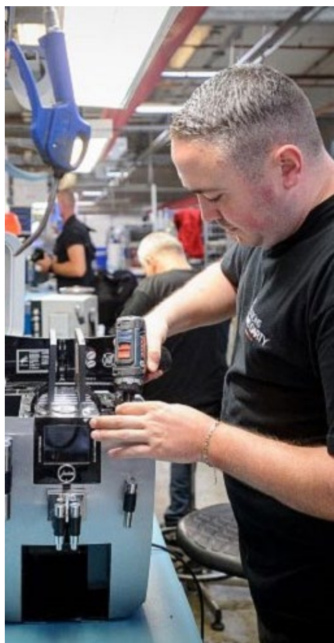
图片说明：维修中心