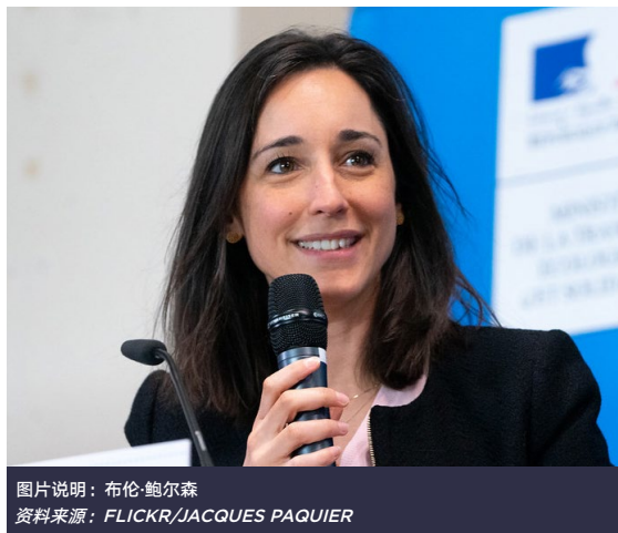
图片说明：布伦·鲍尔森

《反废弃物法》建立在早期法律的基础上，是多年工作的成果。法国相继出台的国家政策和法律促成了该项法律的通过，可帮助减少废弃物和完善资源管理。2015年《绿色增长能源转型法》 19 和2017年《法国气候变化计划》 20 宣布制定国家循环经济路线图 21 ，该路线图于2018年发布。与此同时，2016年通过的《反食品废弃物“加罗法”》 22 规定禁止销毁可食用的未售出食品，为《反废弃物法》中更广泛地禁止销毁未售出商品开了先例。此外，埃马纽埃尔·马克龙在总统一计划中设定了雄心勃勃的目标，即到2025年实现塑料100%回收，并将垃圾填埋减半。 23